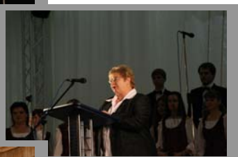
Gäste der Eröffnungsfeier in der Aula der MSLU