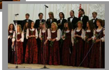
Chor der Minsker Staatlichen Linguistischen Universität „Cantus Juventae“

Der Herbstempfang der Deutschen Botschaft im Haus der Freundschaft am 30. September brachte wieder viele gute Bekannte zusammen und gab die Gelegenheit, in einer informellen Atmosphäre neue Menschen kennen zu lernen und Kontakte zu knüpfen.